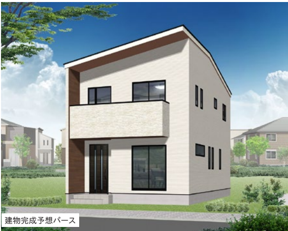
建物完成予想パース