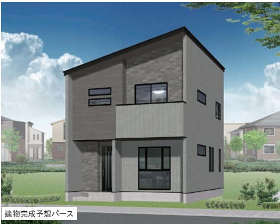
建物完成予想パース