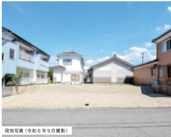
現地写真 (令和6年9月撮影)