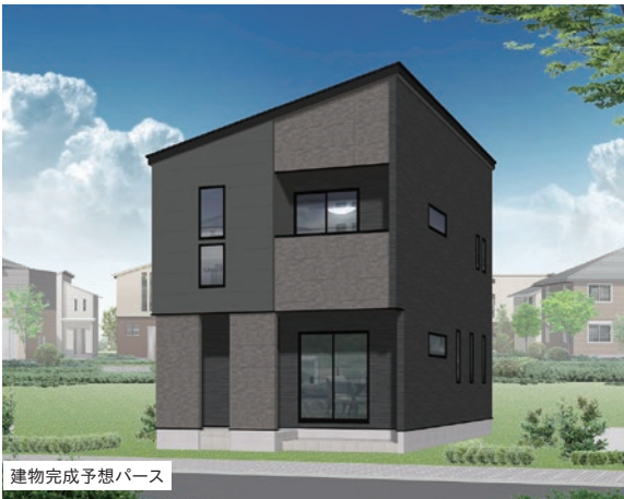
建物完成予想パース