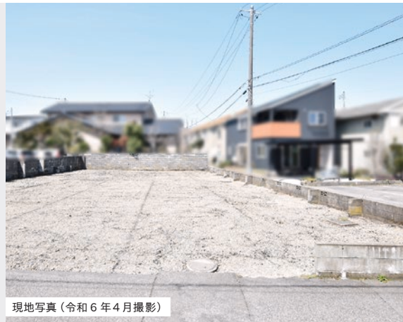
現地写真(令和6年4月撮影)