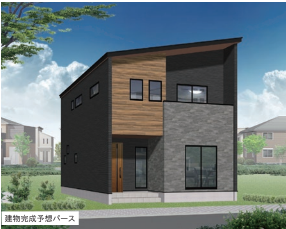
建物完成予想パース