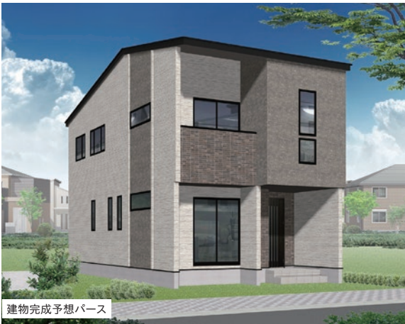
建物完成予想パース