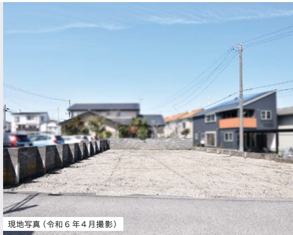
現地写真(令和6年4月撮影)